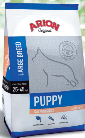
PUPPY LARGE BREED ŁOSOS & RYZ