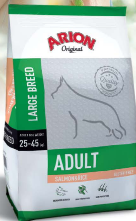
ADULT LARGE BREED ŁOSOS & RYZ