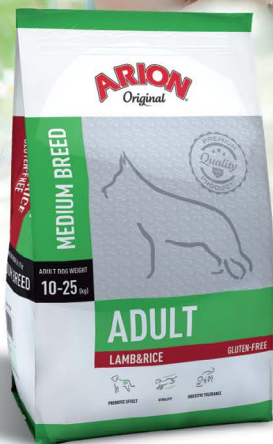
ADULT MEDIUM BREED JAGNIĘCIA & RYZ