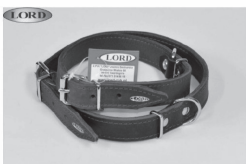
Wyroby ze skóry natłuszczonej