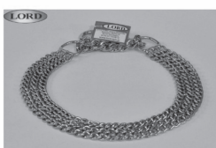
Wyroby z metalu