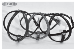
Szelki skórzane i welurowe