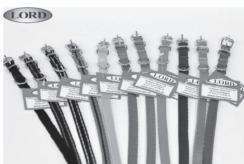
Wyroby z taśm i sznurów