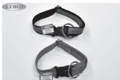
Obroże skórzane i welurowe

Producent galanterii skórzanej dla zwierząt