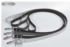
Smycze skórzane i welurowe