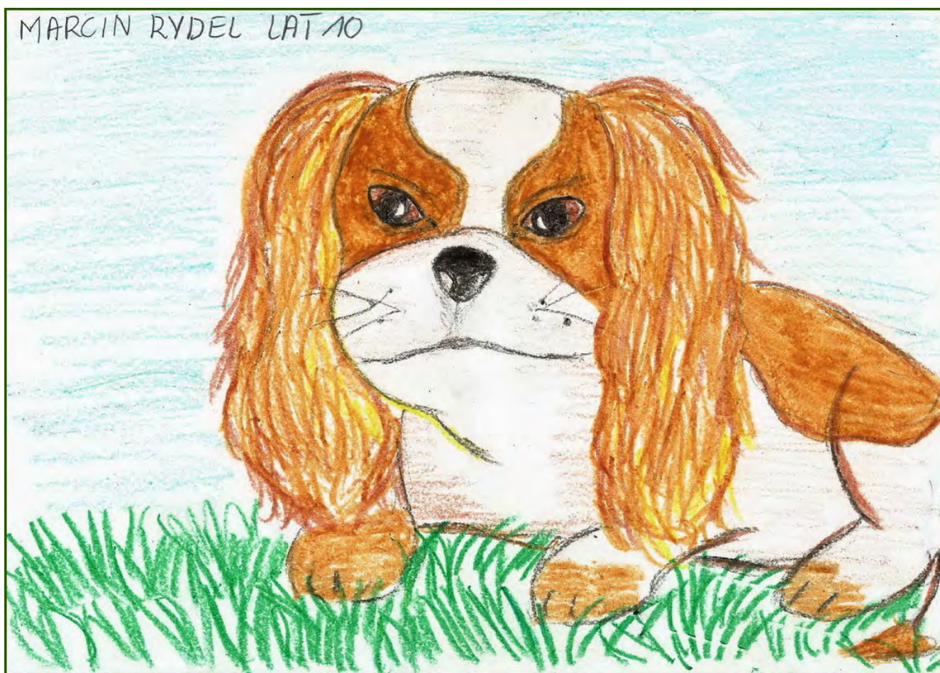
miejsce 2 - Marcin Rydel lat 10