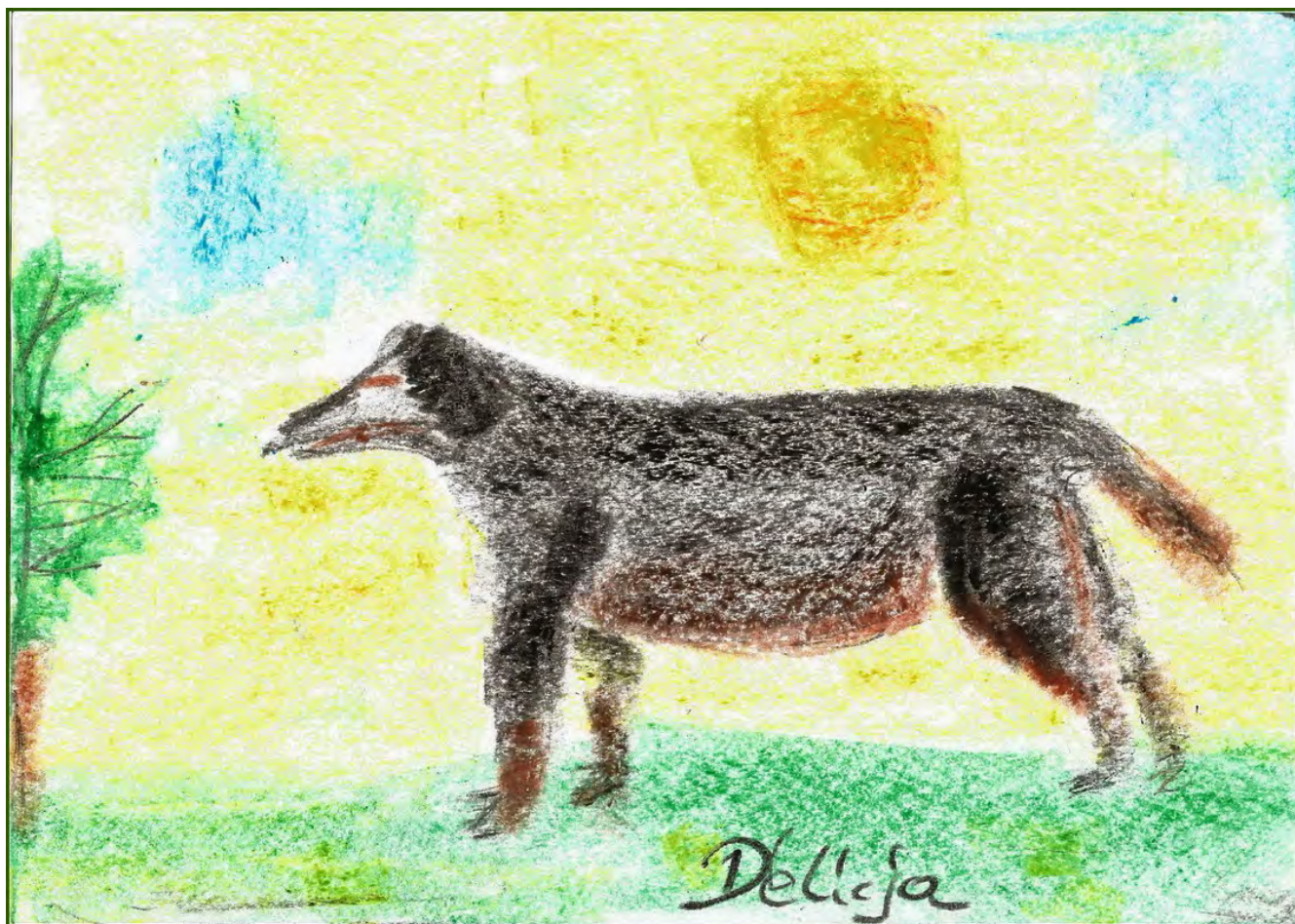
miejsce I - Dominik Flak-Drechnowicz lat 11

Prace nagrodzone na poprzedniej wystawie ExpoSilesia-DogShow 2017 w konkursie "PIES RASOWY" :