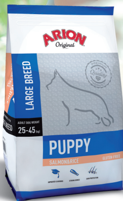
PUPPY LARGE BREED ŁOSOŚ & RYZ