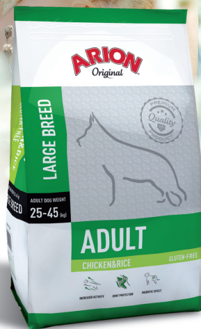
ADULT LARGE BREED KURCZAK & RYZ