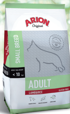
ADULT SMALL BREED JAGNIĘCINA & RYZ